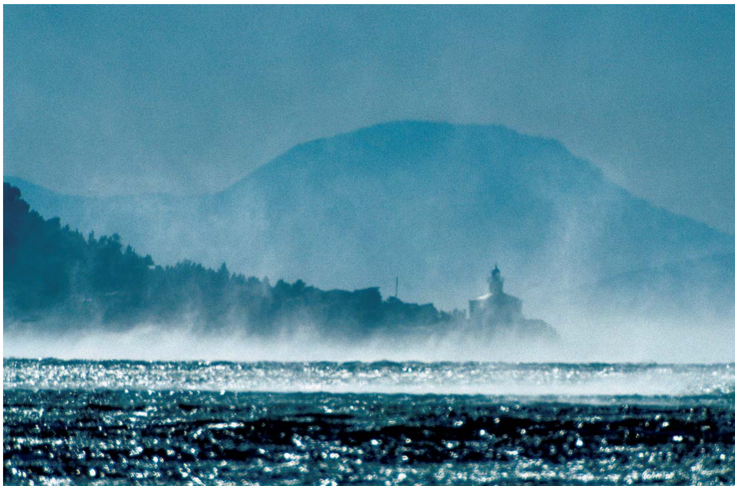
Svjetionik na buri – Makarska. Leuchtturm bei der Bora – Makarska.