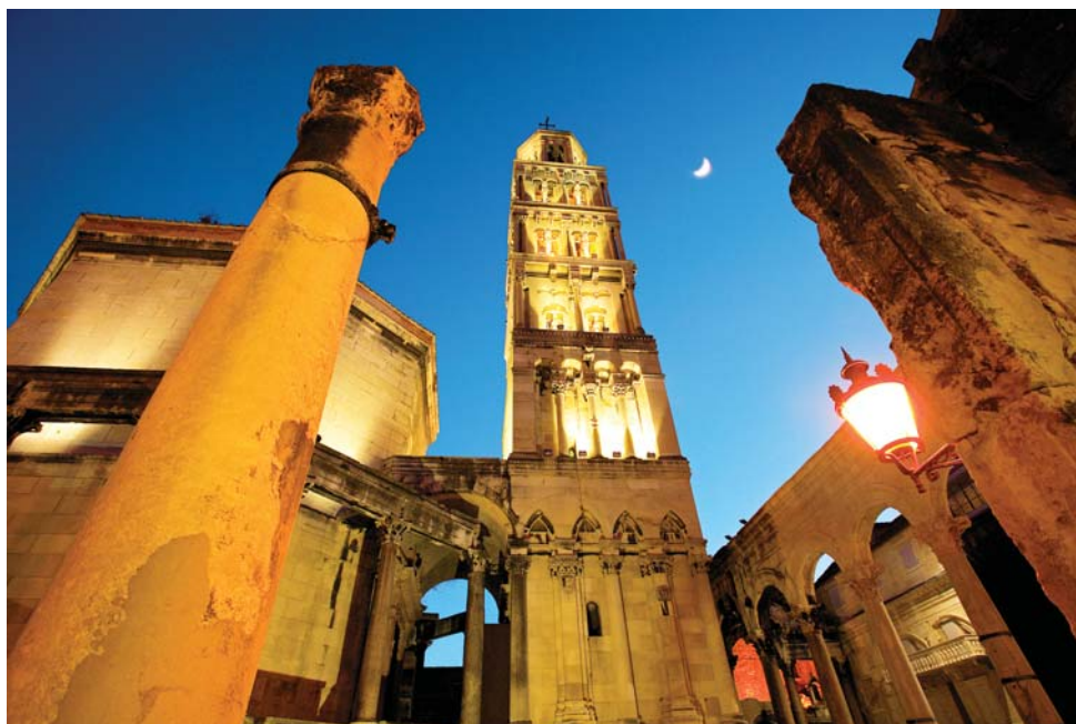
Andrija Carli: Katedrala. Der Dom.

Andrija Carli (1950) beschäftigt sich seit 1980 professionell mit der Fotografie. Man merkt diesem Liebhaber des Schönen an, dass er in seinen Fotografien die Wirklichkeit noch schöner darstellen will als sie ist. Sein Hauptanliegen in der Fotografie ist daher, Menschen, Ereignisse und die wunderschönen Landschaften und Städte, die Dalmatien zur Genüge hat, abzulichten. Seine Werke, die als eines der reichsten Fotoarchive über Dalmatien und die kroatische Küste gelten, sind bald im Internet zu bewundern.